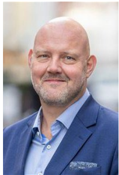
Direktør, Partner & Erhvervsrådgiver, MDE